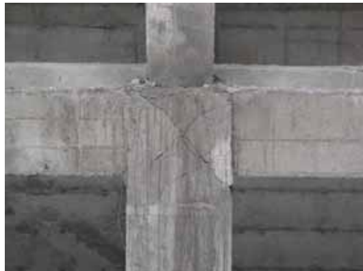
写真85 杭頭柱梁接合部のせん断ひび割れ