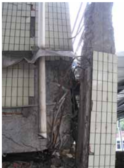
写真77 1層崩壊した柱頭の損傷 ( )