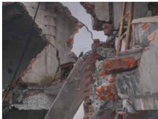
写真8 レンガ壁の損傷