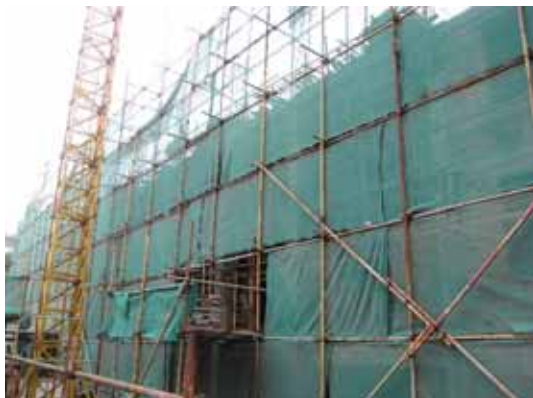
写真67 建設中の集合住宅の全景

5階で配筋中の柱主筋の継手には、圧接継手を使用されているが（写真71）、どのような施工管理を行っているかは不明である。