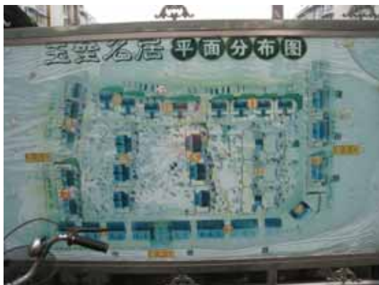
写真111 玉墨名居内の建物配置図