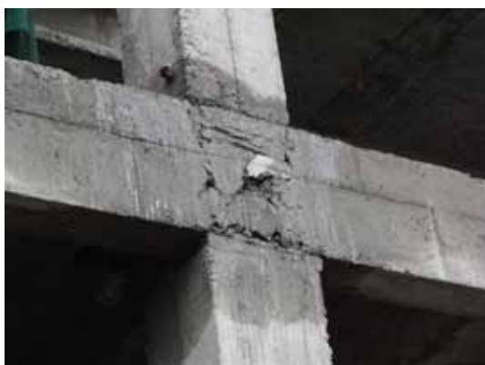
写真101 接合部のせん断ひび割れ