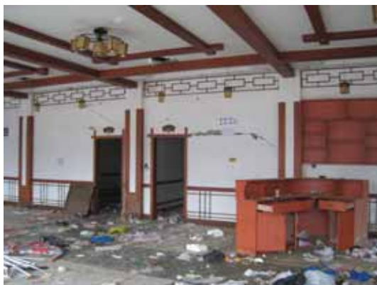
写真18 建物内部の壁の損傷