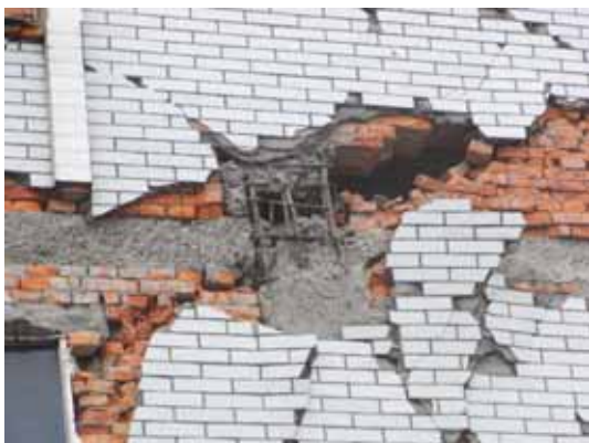
写真17 柱脚と柱梁接合部のコンクリートの崩落