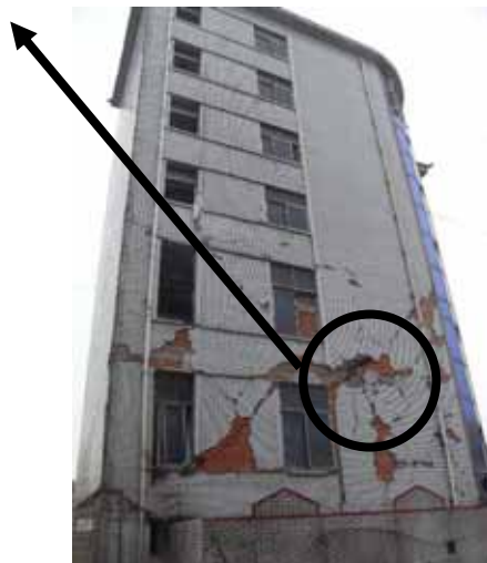
写真19 妻面におけるレンガ壁のひび割れ