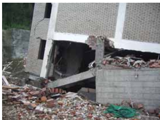
写真88 中央建物の山側ピロティ柱の崩壊