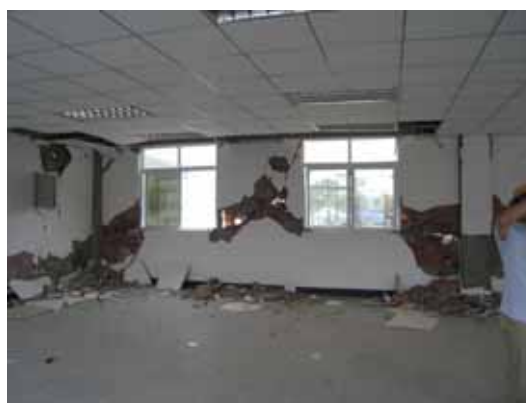
写真56 復旧可能性の判定結果表示 (D判定：復旧不能・改築)