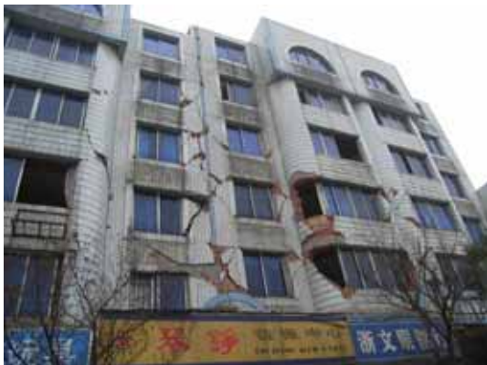
写真13 警察署周辺の集合住宅（外壁に損傷）