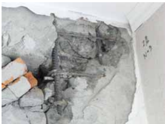
写真105 柱頭のせん断破壊