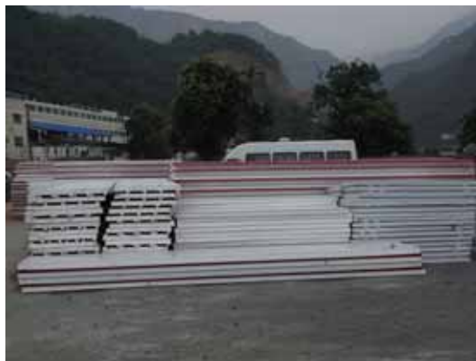
写真38 貨物駅で積み下ろした仮設住宅用と思われる資材