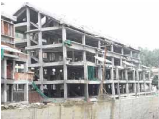
写真95 骨組だけの建物全景