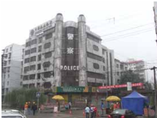
写真9 警察署全景（街区入口で立入禁止）