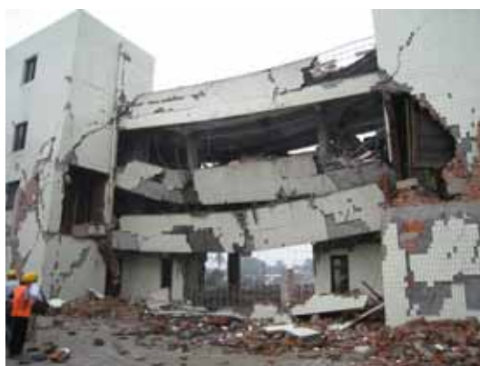
写真73 2階の層崩壊部分（ ）