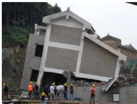
写真87 2階層崩壊により道路側に傾斜