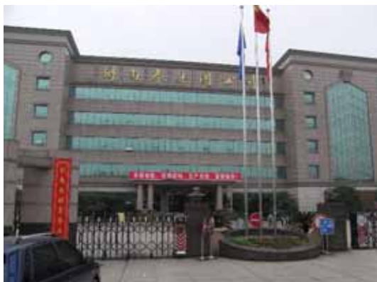
写真63 劍南春集團公司の全景

趙世春教授によれば、レンガ壁などの非構造材の補修・補強に時間と経費を要するため、建物所有者は建て替えを検討しているとのことである。