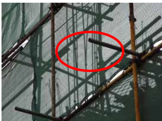
写真71 柱主筋の圧接継手