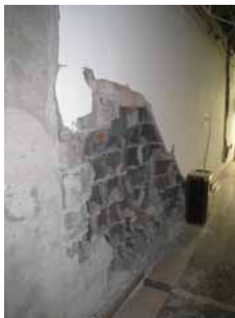
写真66 ブロック壁の損傷状況