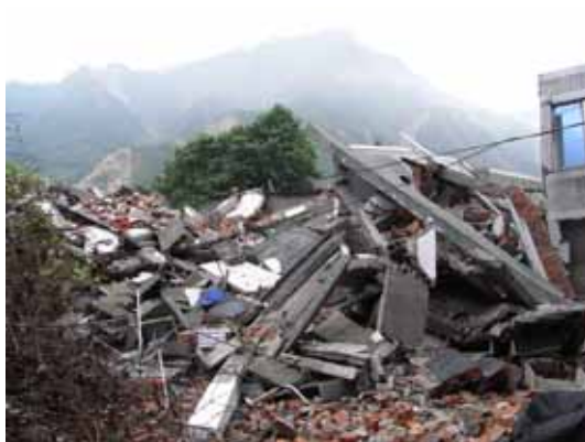
写真48 完全に倒壊した6階建て建物