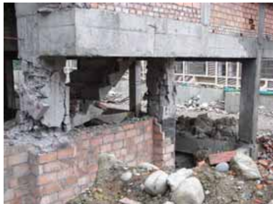
写真96 短柱と長柱が混在により短柱がせん断破壊