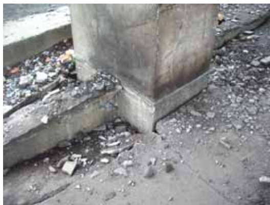
写真29 1階床スラブの沈下の形跡