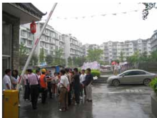
写真122 説明を求める住民