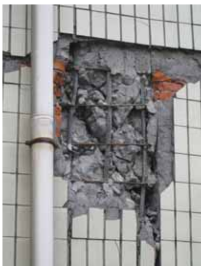
写真78 1階短柱のせん断破壊 ( )