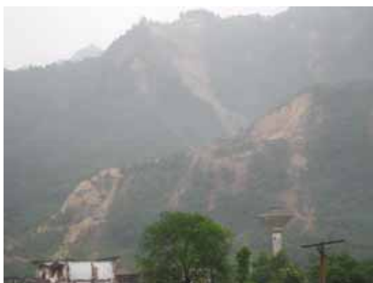
写真37 周囲の山の斜面崩壊