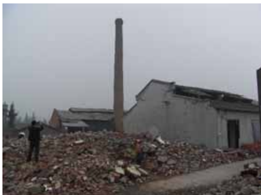
写真1 徳陽市のレンガ造きのこ栽培工場