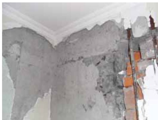
写真104柱頭打ち継ぎ部の損傷