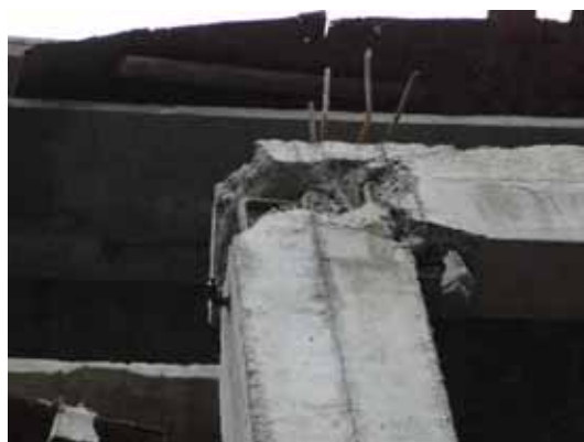
写真102 接合部の破壊

なお、この建設地の地盤は粘土質であり、至る所に水溜りが目立ったが、このような粘土質の表層地盤に杭となる柱が直接支持されていたことも被害に繋がる要因のひとつであったと考えられる。