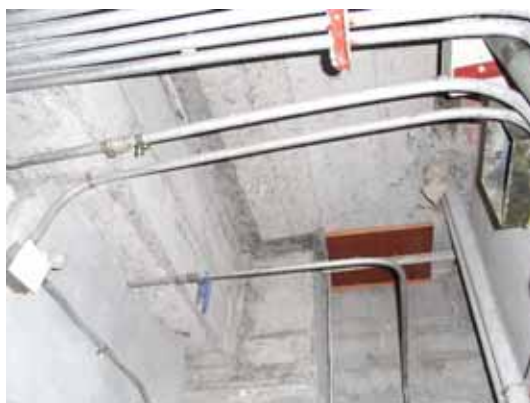
写真110 点検口等から見える躯体コンクリートの品質は良好