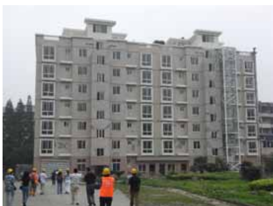
写真103 新館建物全景

この建物は、鉄筋コンクリート造の壁式ラーメン構造であり（写真103）柱は厚さ200mmのL型やT型の断面が使われている。柱にはせん断ひび割れが生じた箇所もあるが損傷は比較的軽微である。コンクリートの打ち継ぎが損傷を誘発したと思われる箇所があった（写真104,105）。一方で架構に充填したブロック壁にはせん断ひび割れが多数見られ、仕上げのモルタルが剥落しているところも多い（写真106）。構造躯体は小破であるが、ブロック壁、レンガ壁については大破であった。また、階段に水平方向のひび割れが生じていた。壁柱の設計では、壁の幅と厚さの比で分類し、5以下では柱扱い、8以上では壁扱いとなり、その中間は規定が無いので適切に判断してどちらかに分類するとの事であった。