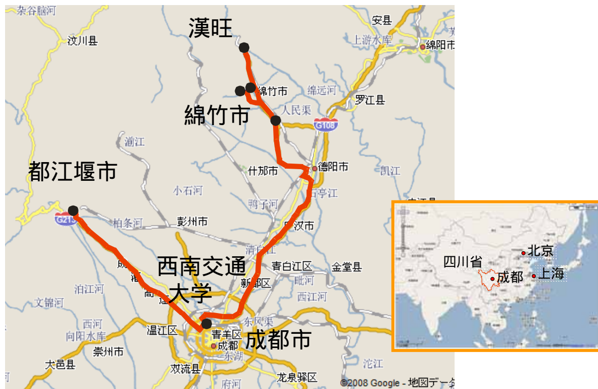
図1 調査地点（ ～ ：6月21日、 ～ ：6月22日）

建築学会が派遣した復旧技術支援チームが現地調査を行った地域の地図に被災建築物の調査地点を記入して図1に示す。