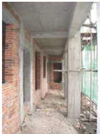
写真68 バルコニー部分はRC架構で住居部は組積造