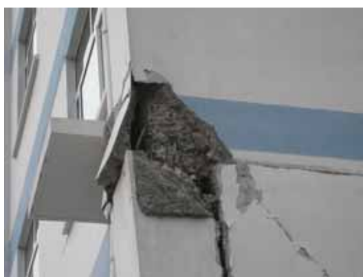
写真52 柱頭と柱梁接合部の損傷