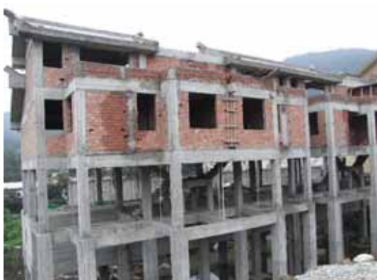
写真84 杭埋め戻し前の建物全景

この建物の販売価格は、15000元/m 2 （23～24万円）であり、現地では高級住宅である。