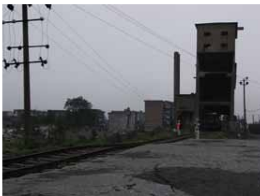
写真30 地盤変状による線路面の波打ち