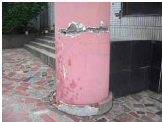
写真59 1階丸柱の打ち継ぎ部分の水平のひび割れ