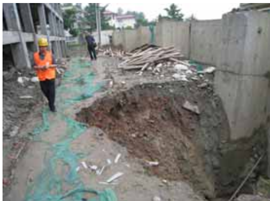
写真99 擁壁下部から土砂が流出