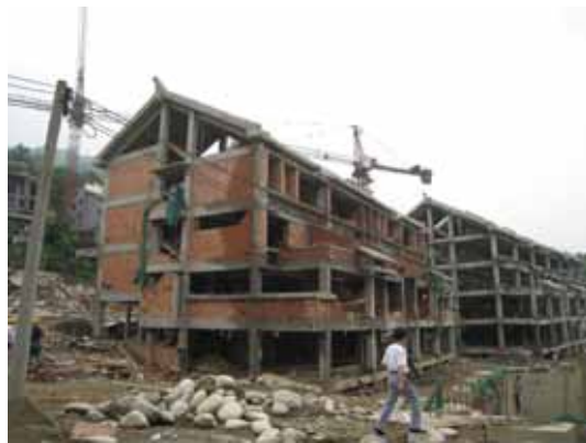
写真94 レンガ壁が施工された建物全景