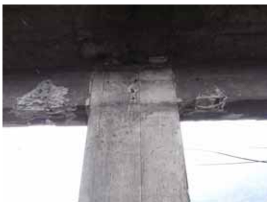
写真34 長辺方向の2階梁端の塑性ヒンジ