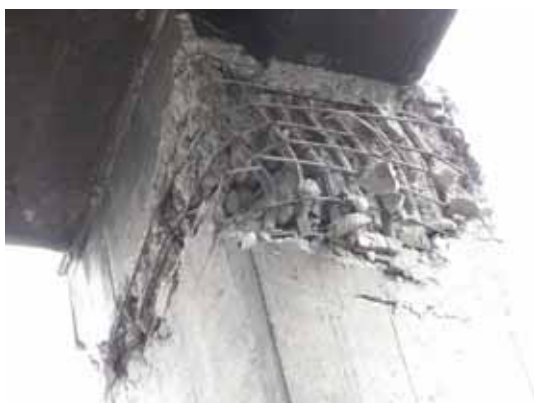
写真32 1階柱頭の短辺方向の塑性ヒンジ