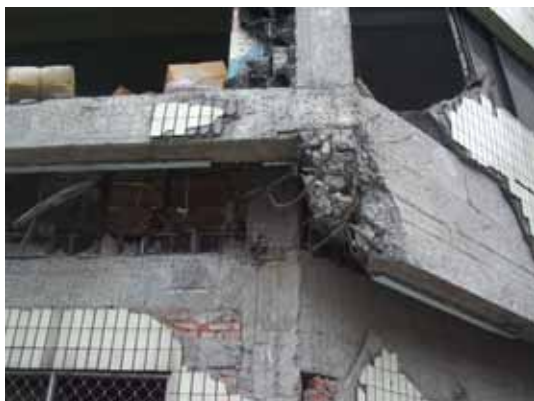
写真74 層崩壊した部分のアップ ( )