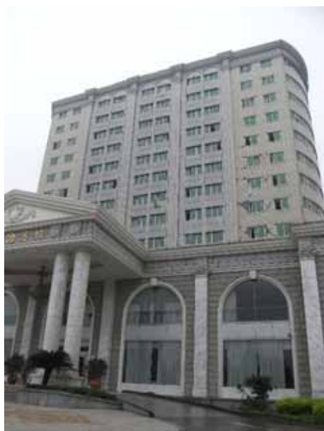
写真107 建物全景、開口周辺のせん断ひび割れ