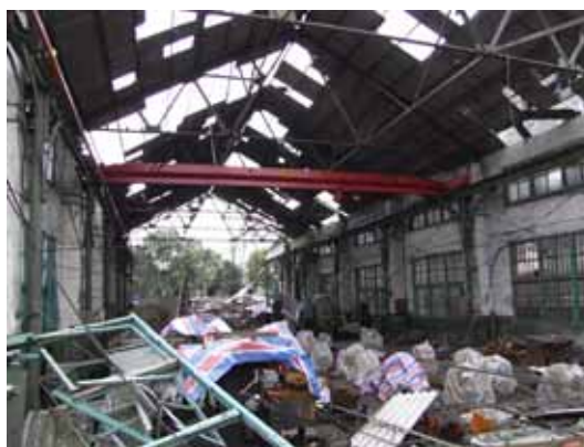
写真40 妻壁が崩落し、屋根材も落下