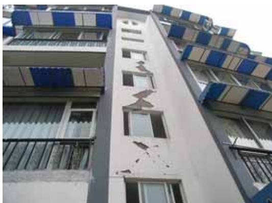
写真121 集合住宅の被害は比較的軽微