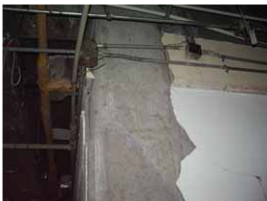
写真65 柱頭せん断ひび割れ(損傷度 )