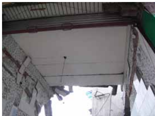
写真6 落下を免れた床スラブ