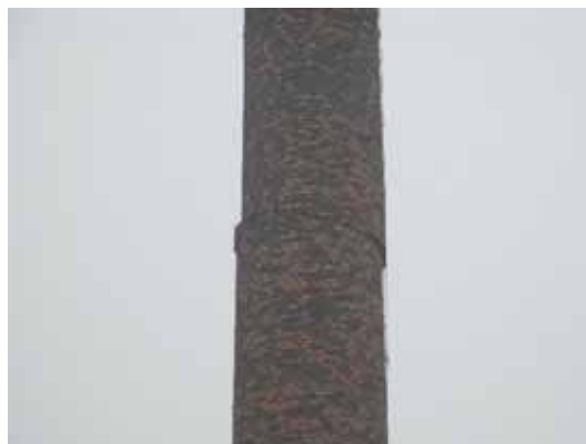
写真2 高さ中央で水平ずれが生じた煙突