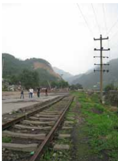
写真31 地盤変状による線路面の波打ち