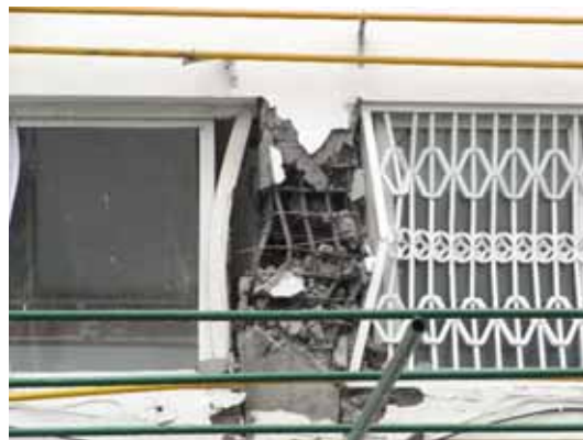
写真116 レンガ造腰壁による短柱のせん断破壊