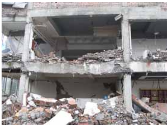
写真119 左側建物の2階梁のたわみ