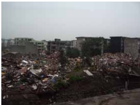
写真24 一帯の集合住宅は高い割合で倒壊