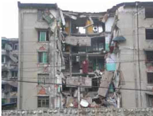
写真21 左写真の崩壊した部分