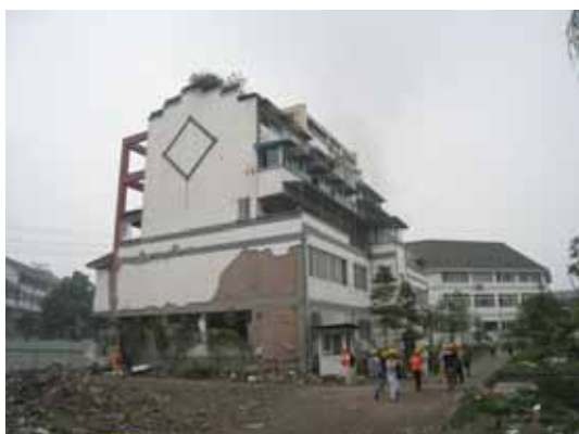
写真117 6階建て集合住宅3棟の右側建物