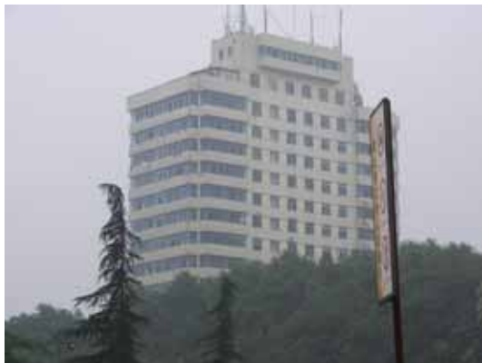
写真25 付近の新しい建物（倒壊していない）