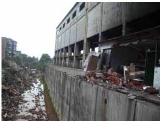
写真28 補給基地は川沿い立地している