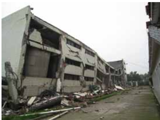
写真76 酒造タンクのある4層部分 ( )