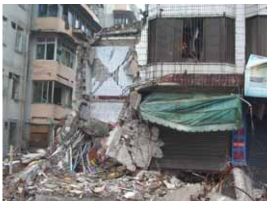
写真11 崩壊部分の拡大