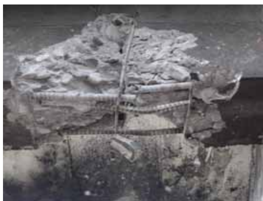
写真35 左写真の塑性ヒンジの拡大