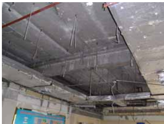
写真64 PCa床板による床スラブ