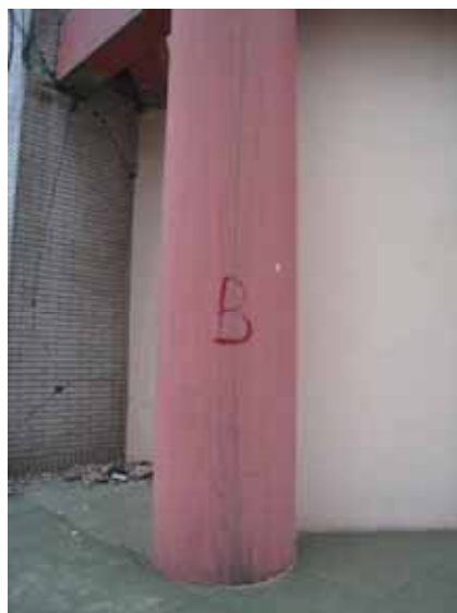
写真61 復旧可能性のB判定(補修で復旧可能)