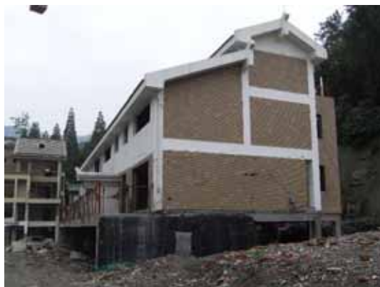
写真90 レンガ壁のひび割れ