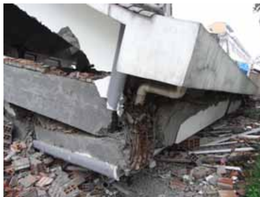
写真114 崩壊建物の柱頭