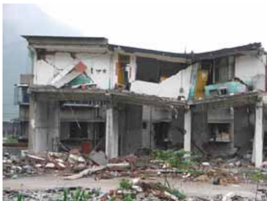
写真22 部分崩壊し大きく変形した住宅