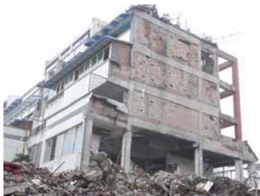
写真118 6階建て集合住宅3棟の左側建物