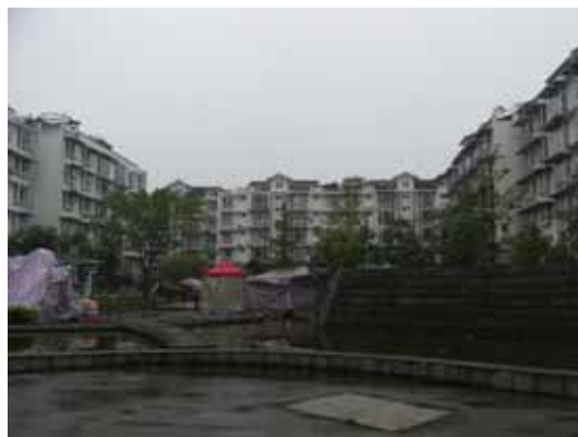
写真112 玉墨名居内の集合住宅