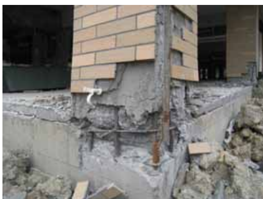
写真82 柱脚主筋の破断