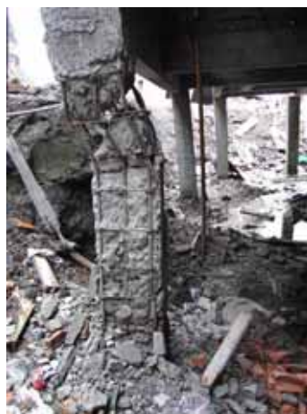
写真89 地盤変状が原因と思われる柱の損傷