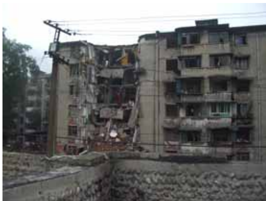
写真20 部分崩壊した集合住宅