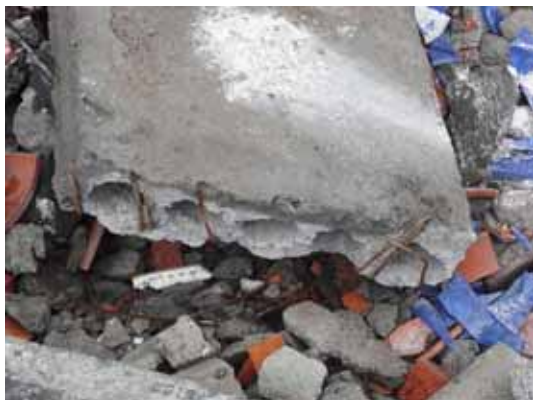
写真7 落下したPCa中空スラブの端部