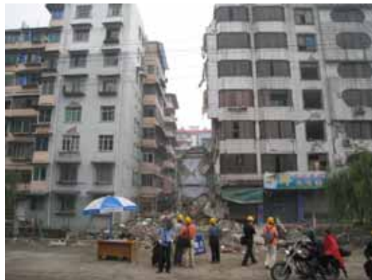
写真10 警察署建物（右）の左端が部分崩壊