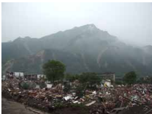
写真36 周囲の山の斜面崩壊

鉄道貨物駅では仮設住宅用の資材（屋根、壁用）の積み下ろしをしていた（写真38）。