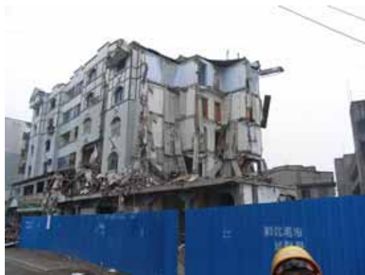
写真124 建物右側の2階から上部の部分崩壊