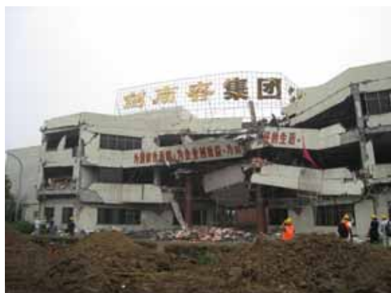
写真72 酒造工場の正面全景（図中）