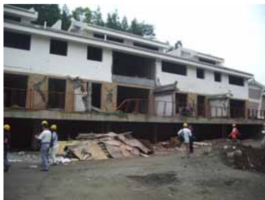
写真91 レンガ壁のひび割れ