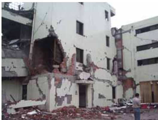
写真75 大破したレンガ壁 ( )