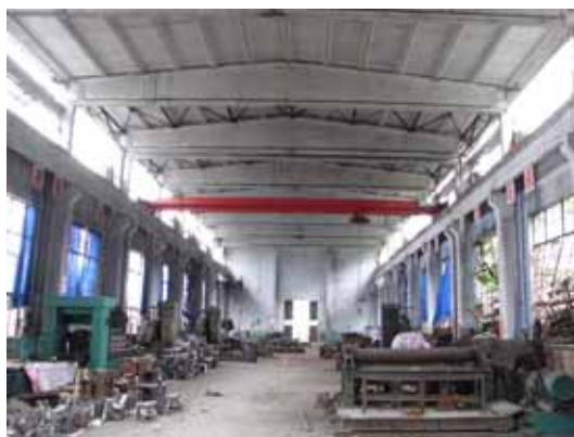
写真43 中規模工場の内部