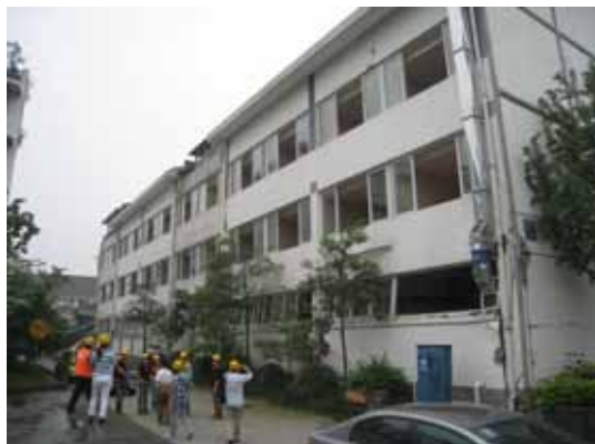
写真115 瓦屋根の3階建て商業ビル全景