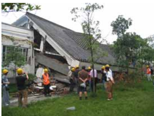
写真113 倒壊した瓦屋根の商業ビル