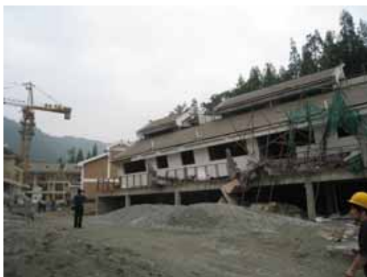
写真86 層崩壊した中央建物全景

道路側から見て右側の建物ではレンガ壁のせん断ひび割れが見られた。中央の建物では、2階が層崩壊し、3階部分が道路側に傾斜した。裏山の地盤にはアースアンカーが施工されているが、数本の柱は地表面の独立基礎が地盤の強制変位により滑動し、柱頭が曲げ破壊し崩壊していた(写真88)。左側の建物でも、1階柱頭が数本曲げ破壊し、鉄筋が露出していた(写真89)。2階レンガ壁にせん断ひび割れは見られたが、倒壊は免れた(写真90,91)。