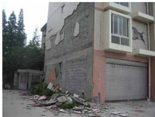
写真106 建物妻面の仕上げモルタルの剥落