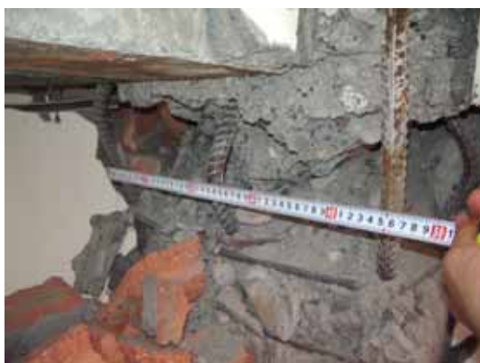
写真53 柱頭の曲げ圧壊と主筋の座屈