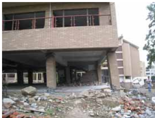
写真81 建物1階に残留変形