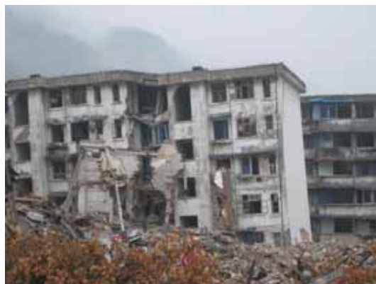
写真23 大きく傾斜した集合住宅