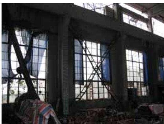
写真44 格子型ブレースの座屈