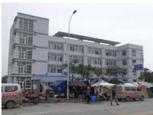
写真51 漢旺公安分局の全景

我々の印象では、非構造体であるレンガ壁のせん断ひび割れなどの損傷は大きい(写真57)もののRC架構の損傷は、一部の柱頭、柱梁接合部に集中しており、補修・補強による復旧も不可能ではない印象を受けた。