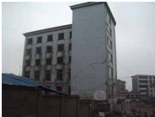
写真16 建物全景（道路と反対側）