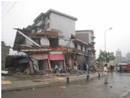
写真3 倒壊した商店の全景