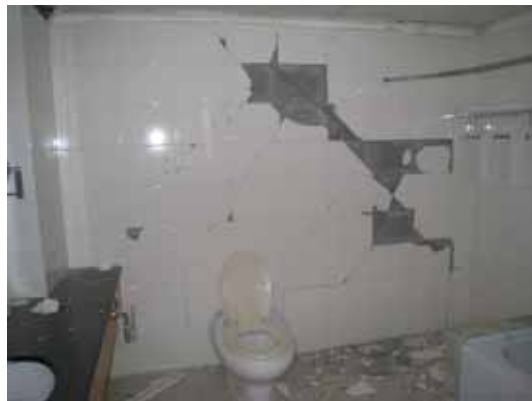
写真109 浴室の仕上げタイルの剥落