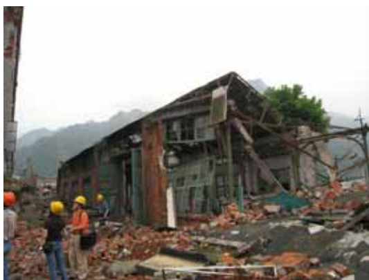
写真39 部分崩壊した小規模工場の全景

また、6階建ての事務所建物が完全に崩壊して瓦礫となっていた（写真48, 49）。この瓦礫には未だ下敷きになっている人がおり、調査時点でも捜索（救出）活動が行われていた。