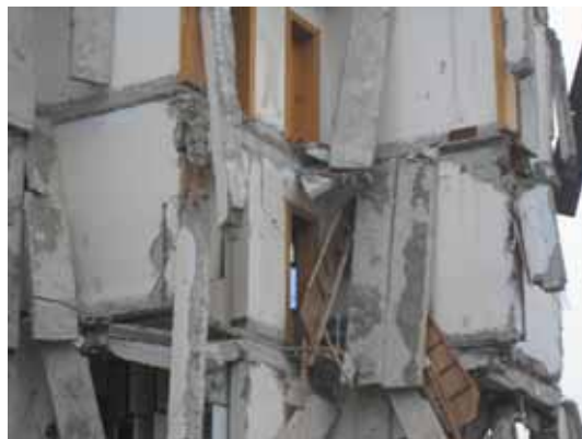
写真125 建物左側の2階から上部の部分崩壊 写真126 PCa中空スラブの崩落