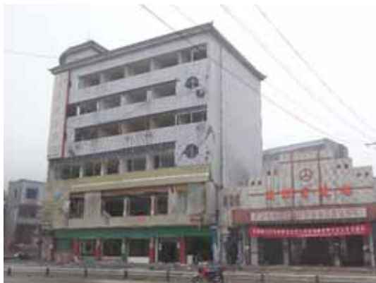
写真15 建物全景（道路側正面）