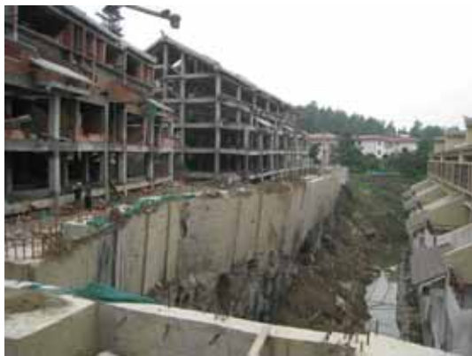
写真93 傾斜地に建設中の2棟の集合住宅