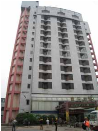
写真58 剣南春大酒店の全景

に対して設計したとのことである。現地で、構造図面を参照することができたが、ラーメン配筋図は無く、柱梁接合部の配筋詳細(横補強筋の有無)は確認できなかった(写真62)。