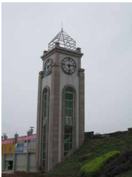
写真50 漢旺中心街の時計台（時計が地震発生時刻で停止）

2階建ての小規模な塔である。構造形式は不明。時計が地震発生時刻の2時28分で停止したままとなっていた（写真50）。