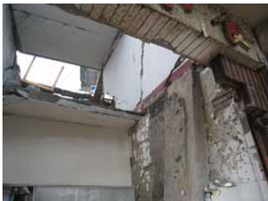
写真5 2階のPCa中空スラブの落下