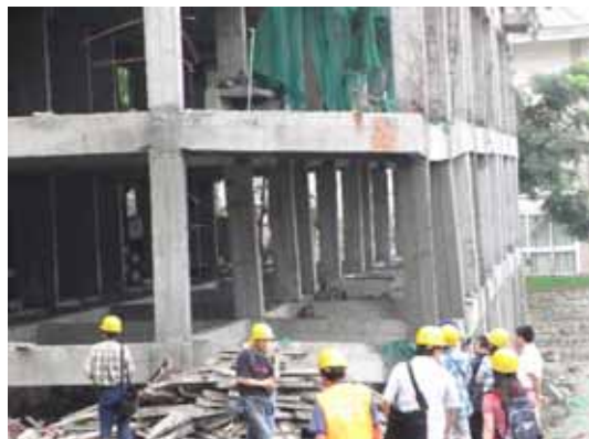
写真100 基礎が強制変位を受け不同沈下