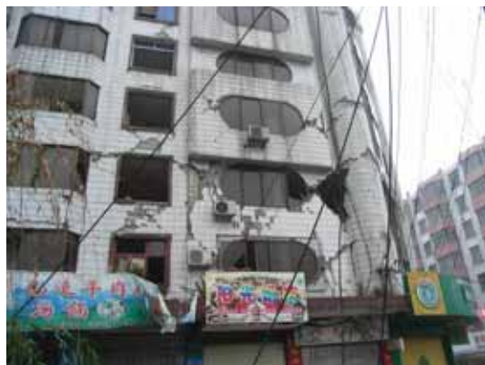
写真12 レンガ壁の損傷