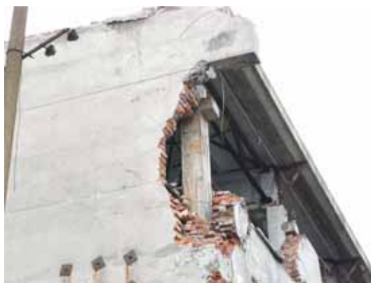
写真45 RC架構外側のレンガ壁の部分崩壊