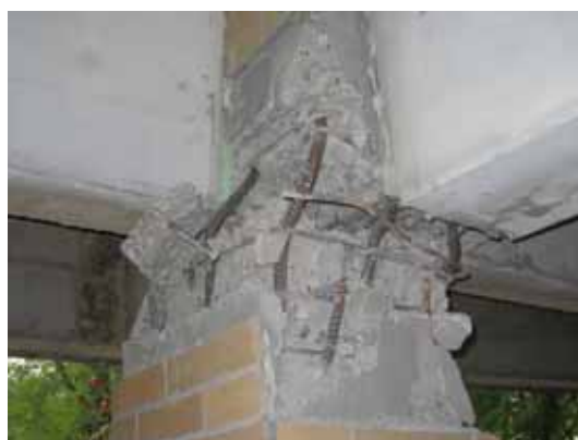
写真83 側柱柱頭の曲げ圧壊（損傷度）