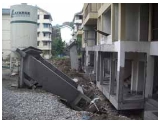
写真92 エントランスゲートの転倒

同じエントランスゲートが2基あり、1基は転倒し、もう1基は大きく傾斜していた。GL - 50cm程度の深さに施工された独立基礎は埋め戻されていなかった（写真92）。