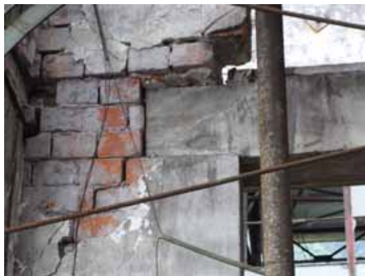
写真41 レンガ壁の面外方向へのずれ