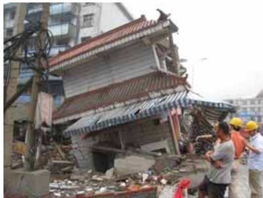
写真4 倒壊した商店の全景