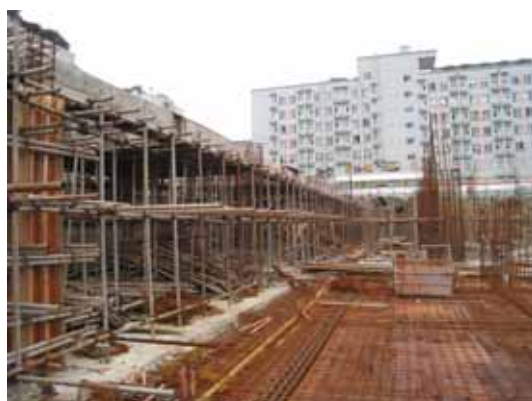
写真127 建設現場入口