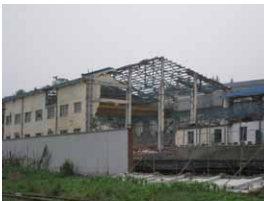
写真47 周辺の他の工場の被害状況