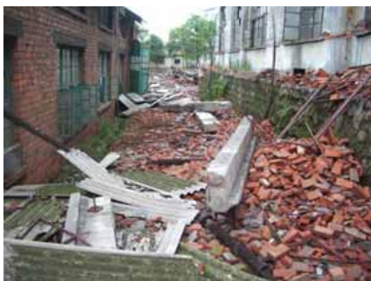
写真46 崩落した外壁レンガと臥梁