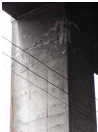
写真33 1階柱頭の打ち継ぎ面の損傷