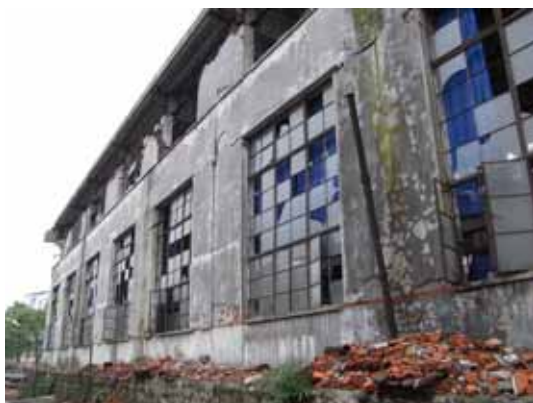
写真42 鉄骨ラチス屋根をもつ中規模工場の外観