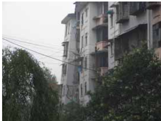
写真14 警察署周辺の傾斜した集合住宅