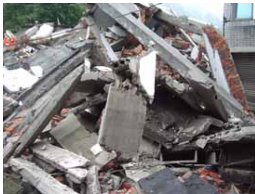
写真49 左写真の拡大