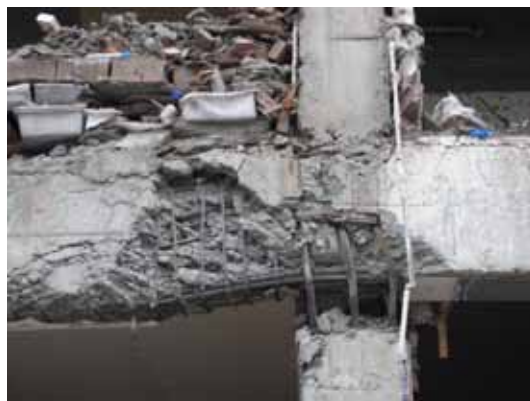
写真120 2階梁柱接合部周辺の損傷状況