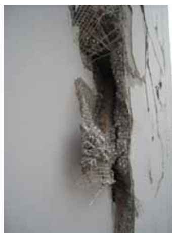
写真54 繊維メッシュを用いたレンガ壁の仕上げ 写真55 左写真ひび割れ部の拡大 (モルタルに発泡スチロールの粒を混入)