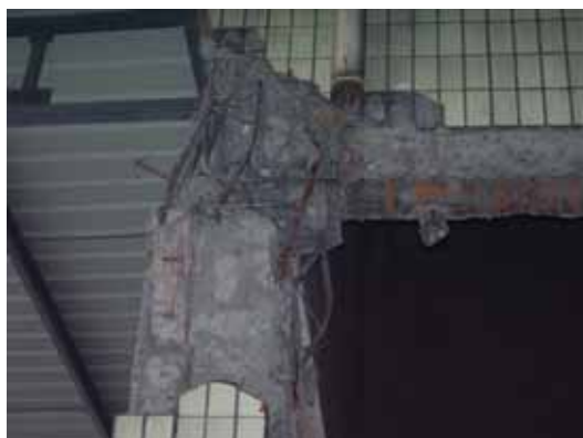
写真79 柱頭部の破壊 ( )

17:10 剣南春酒造工場 出発 19:10 西南交通大学鏡湖賓館 着 19:40 夕食