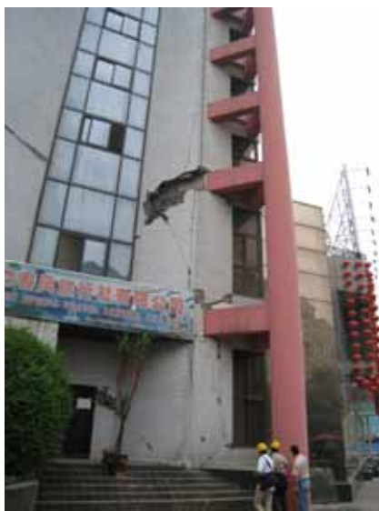
写真60 レンガ壁の損傷