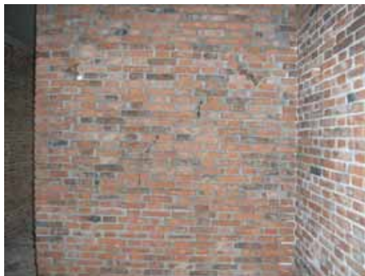
写真70 レンガ壁のせん断ひび割れ