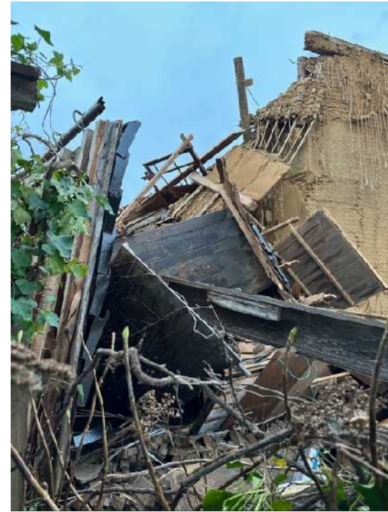
20 漆器店・登録文化財、塗師蔵