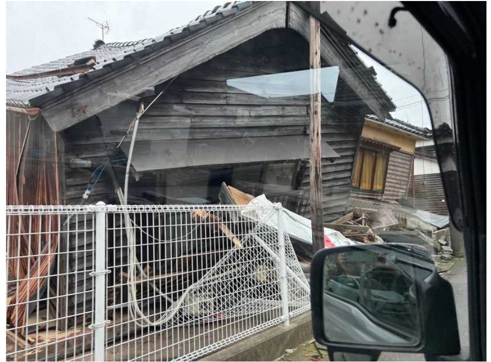
12 輪島の街、鳳至上町