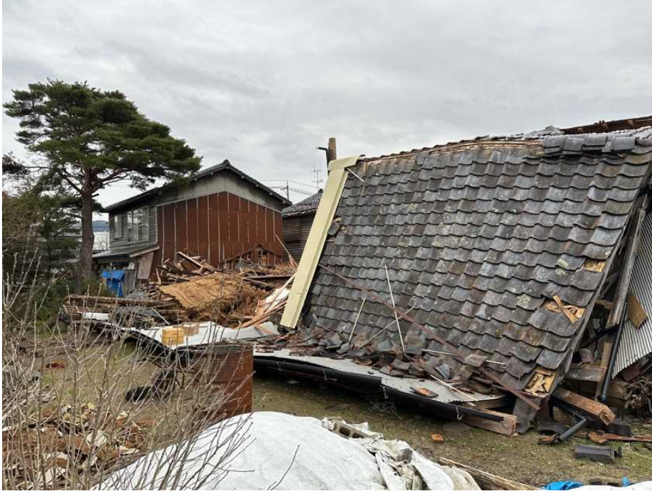
23 輪島の街、鳳至上町、塗師蔵