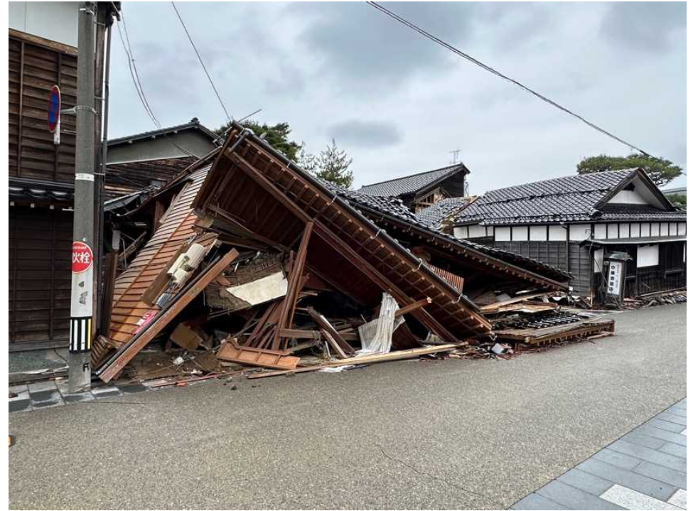
22 輪島の街、鳳至上町