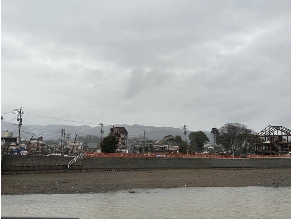
37 輪島の街、鳳至上町から 河井町朝市方面を見る