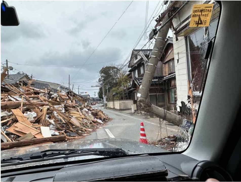
29 輪島の街、鳳至上町