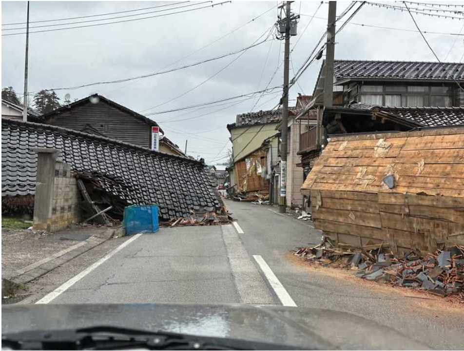
27 輪島の街、鳳至上町