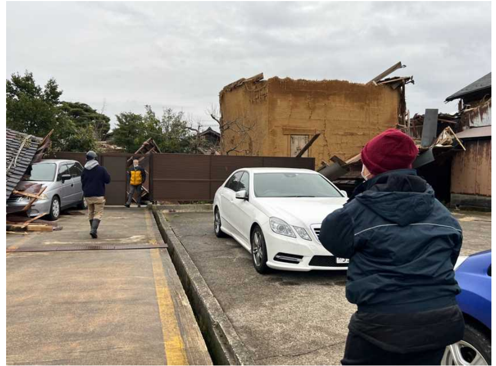
18 漆器店・登録文化財、塗師蔵