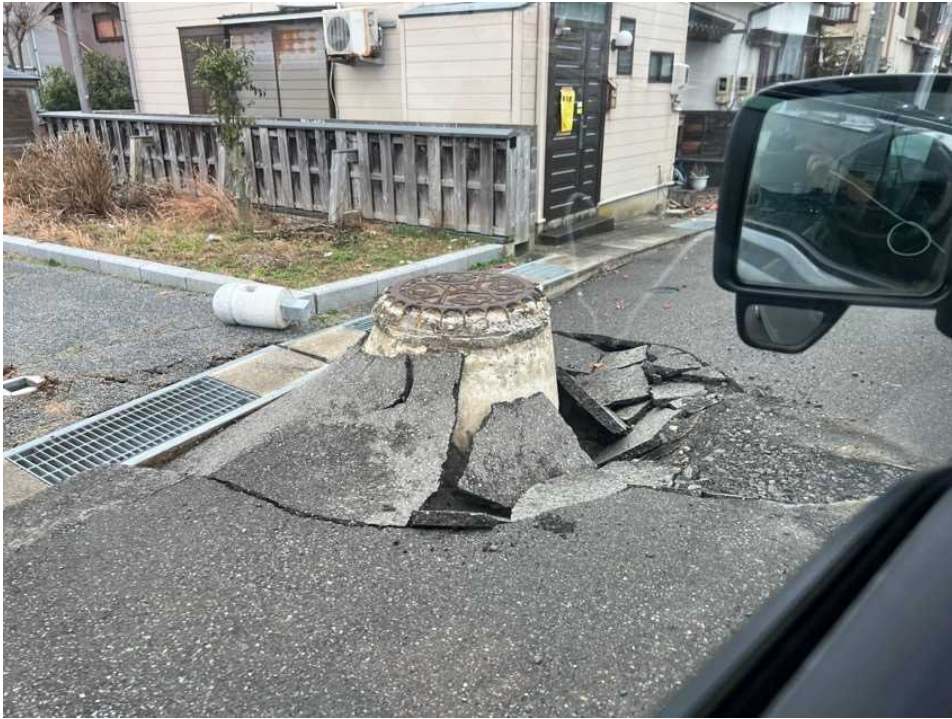
11 輪島の街、鳳至上町