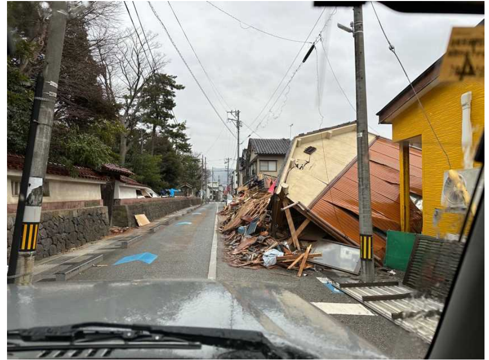
30 輪島の街、鳳至上町