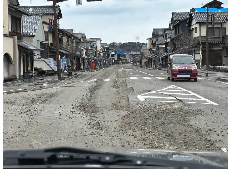
10 輪島の街、馬場崎商店街