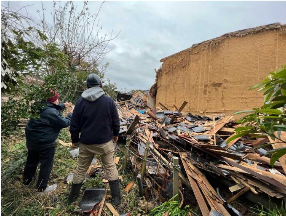
19 漆器店・登録文化財、塗師蔵