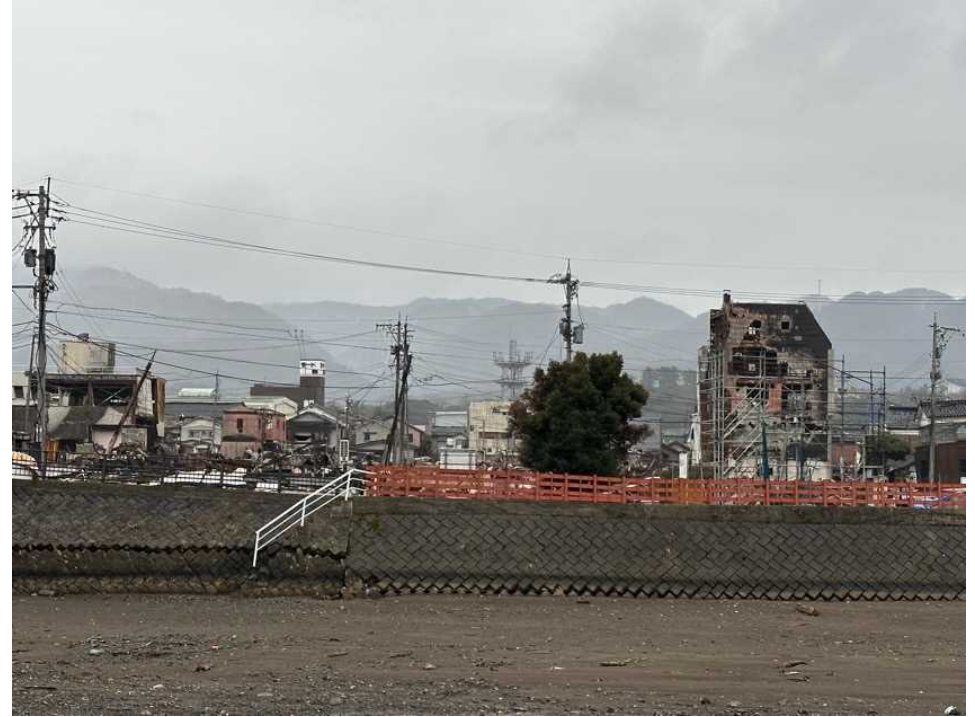
36 輪島の街、鳳至上町から 河井町朝市方面を見る