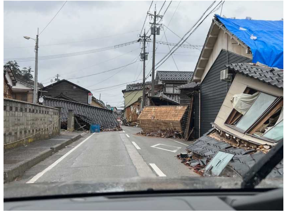
26 輪島の街、鳳至上町