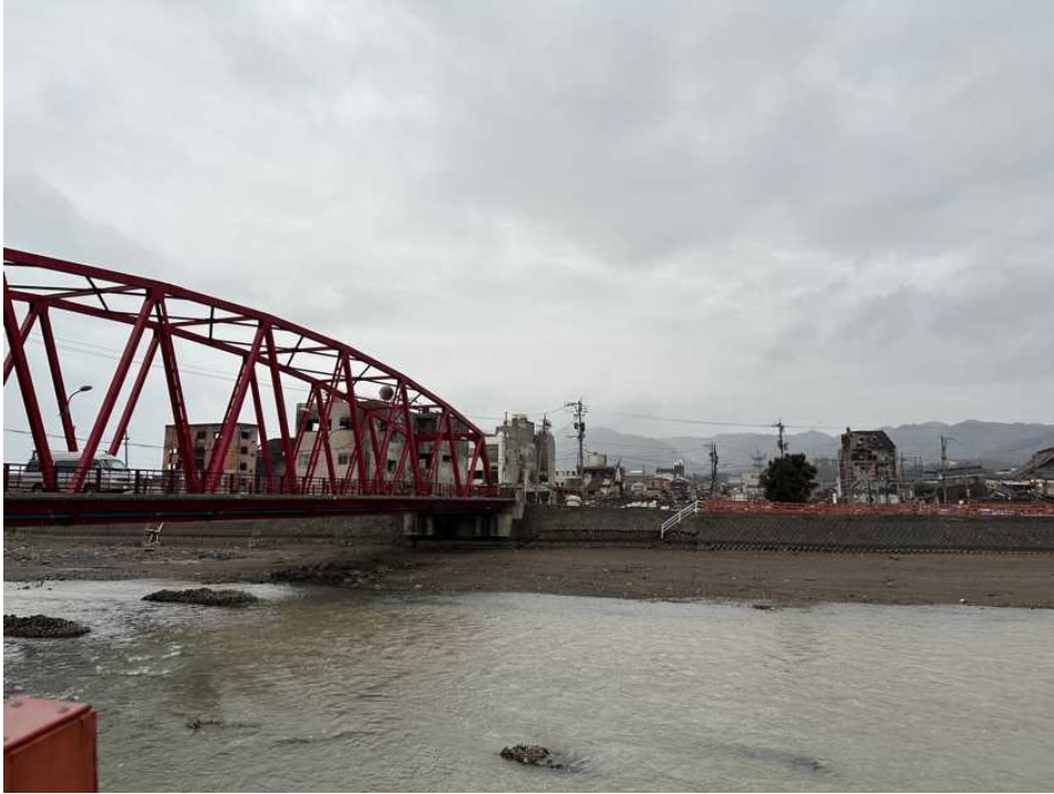
35 輪島の街、鳳至上町から 河井町朝市方面を見る