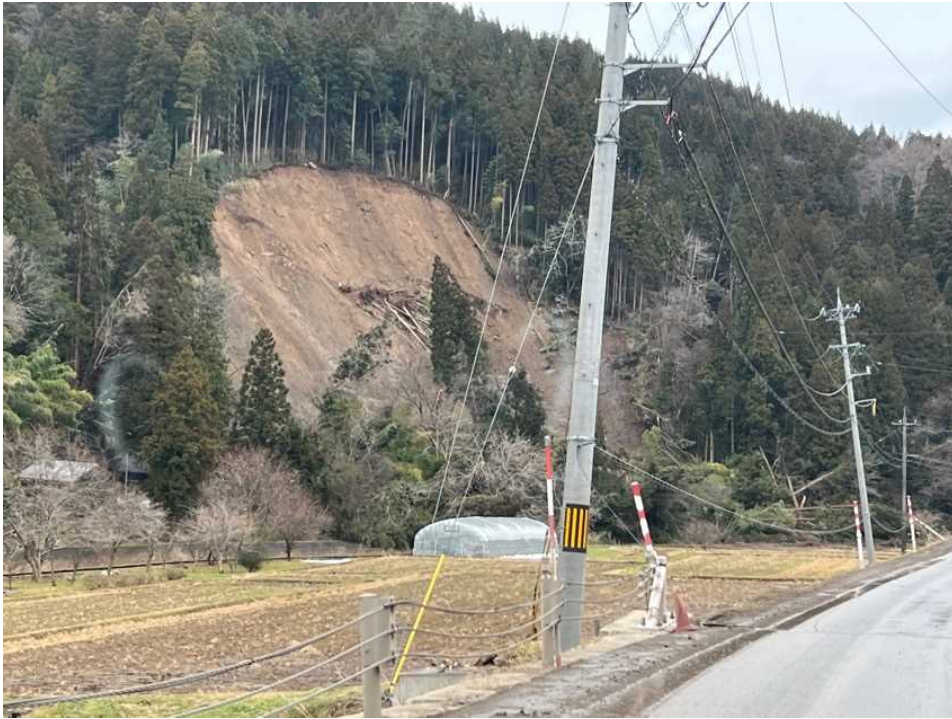
03 三井～輪島の道沿い