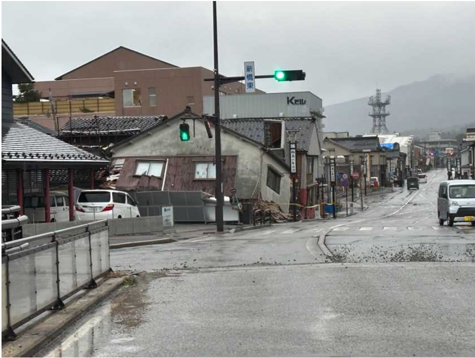
39 輪島の街、河井町、新橋付近