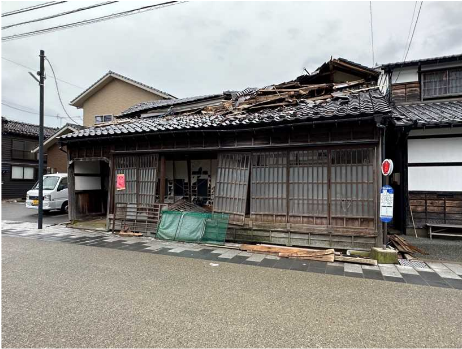
25 輪島の街、鳳至上町、