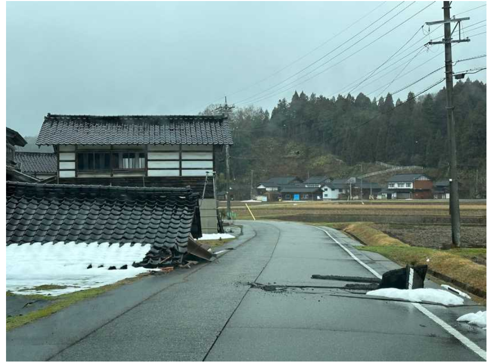
46 三井町、市ノ坂集落