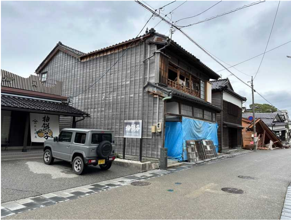
13 漆器店・登録文化財