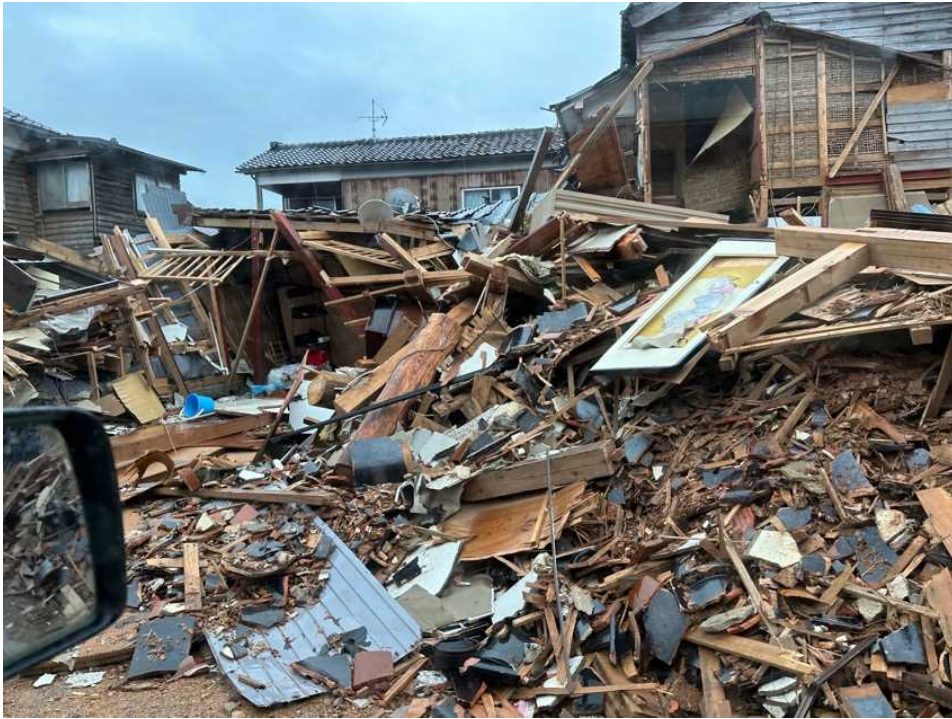
31 輪島の街、鳳至上町