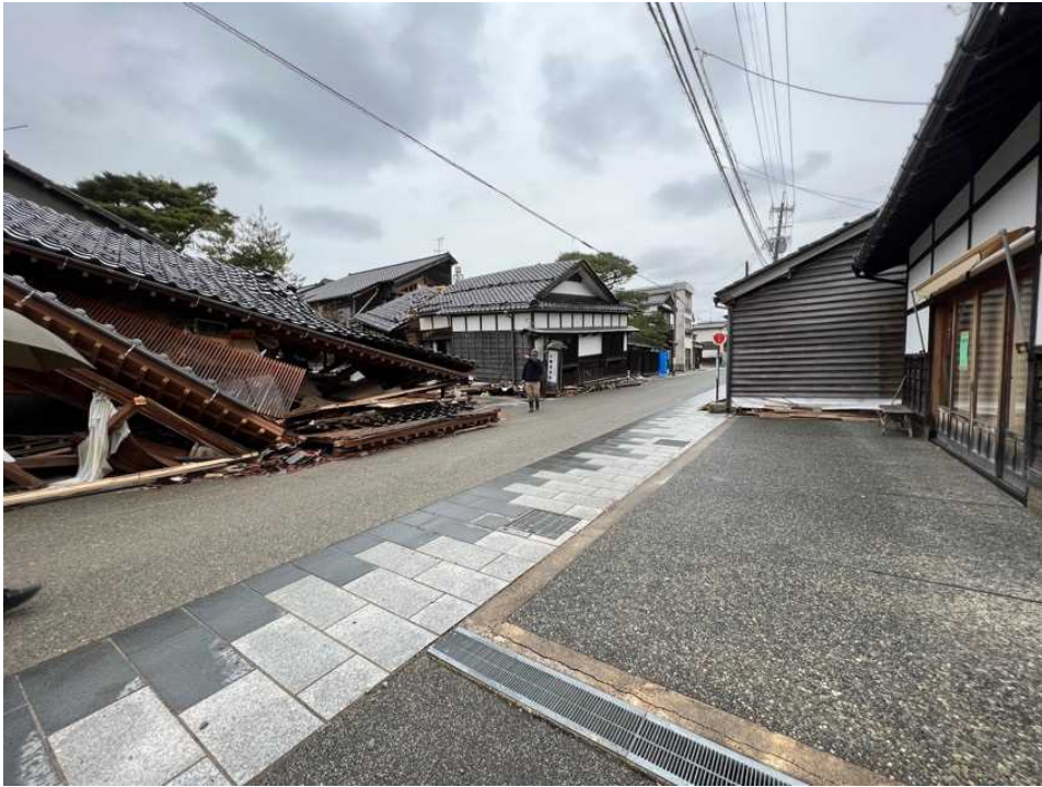
21 輪島の街、鳳至上町