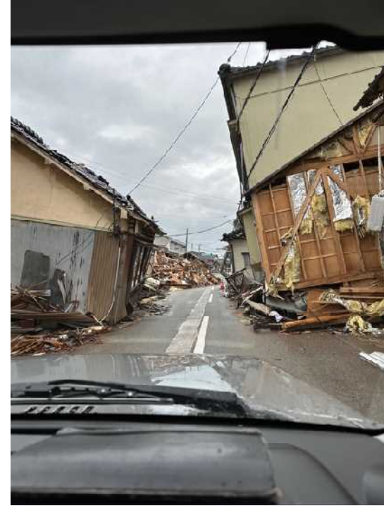
34 輪島の街、鳳至上町