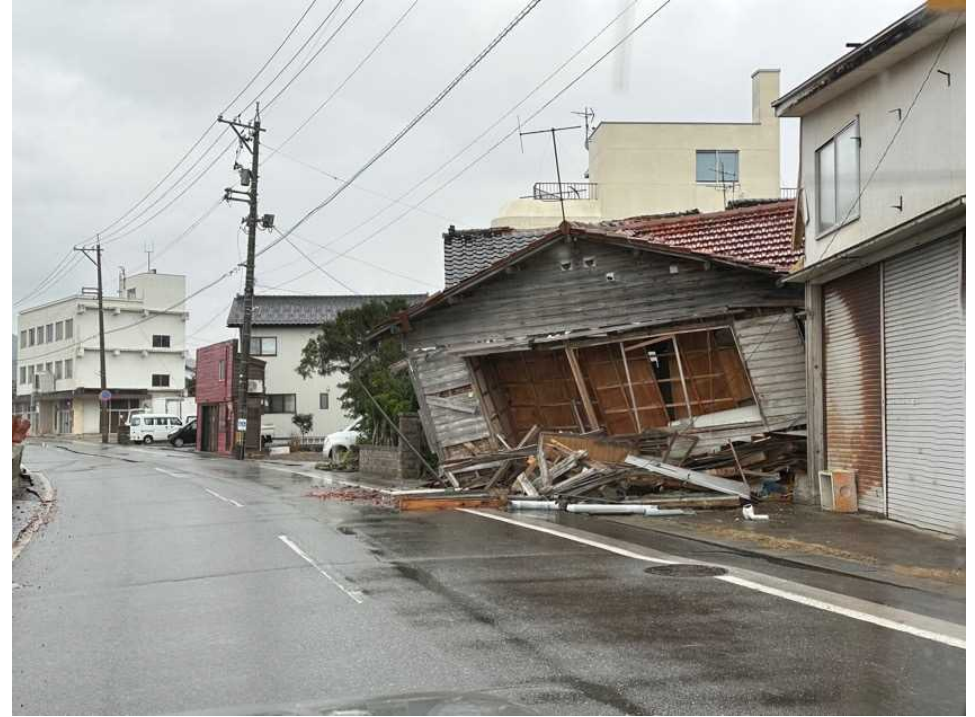
38 輪島の街、鳳至上町、川沿い