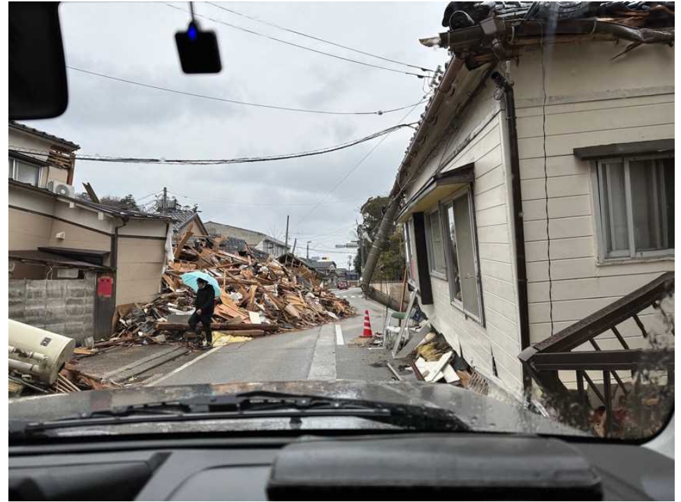
28 輪島の街、鳳至上町