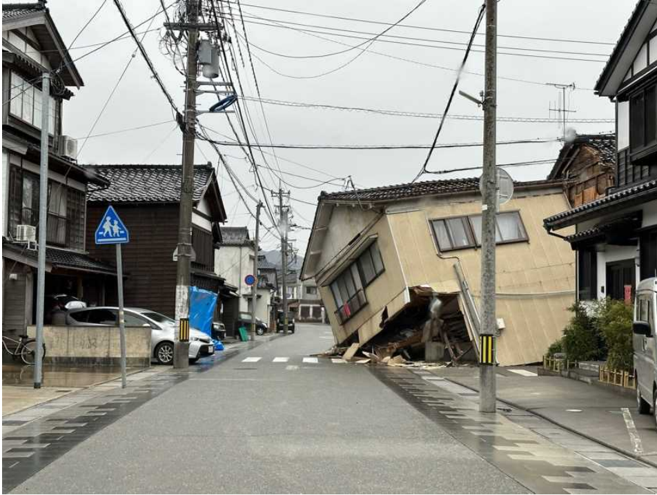
33 輪島の街、鳳至上町