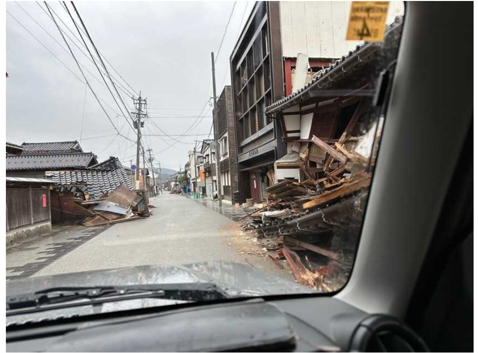
32 輪島の街、鳳至上町