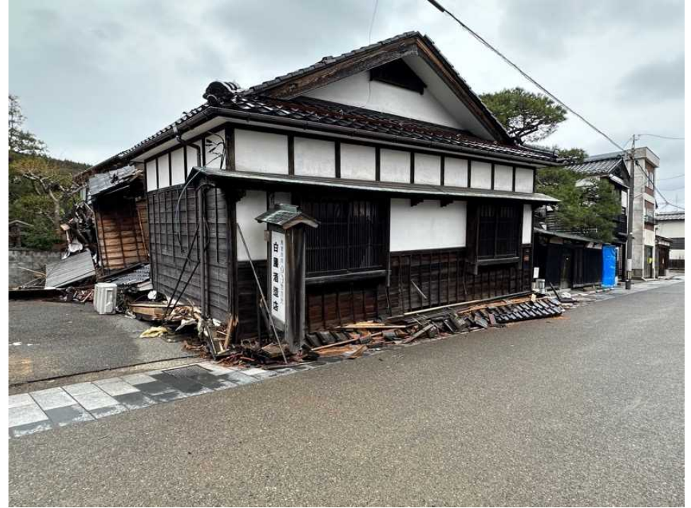
24 輪島の街、鳳至上町、酒造