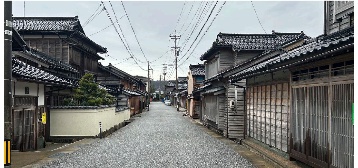
< ㉒ >