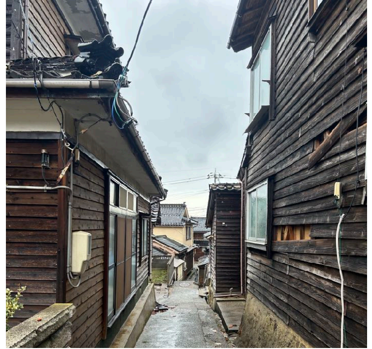
< ⑳ >