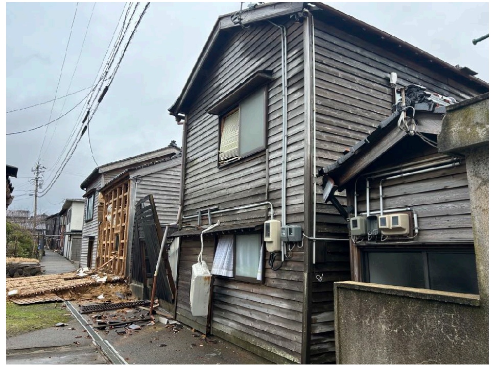
< 33 >