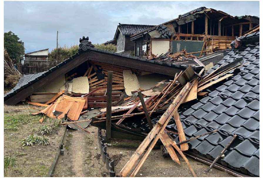
< 31 >