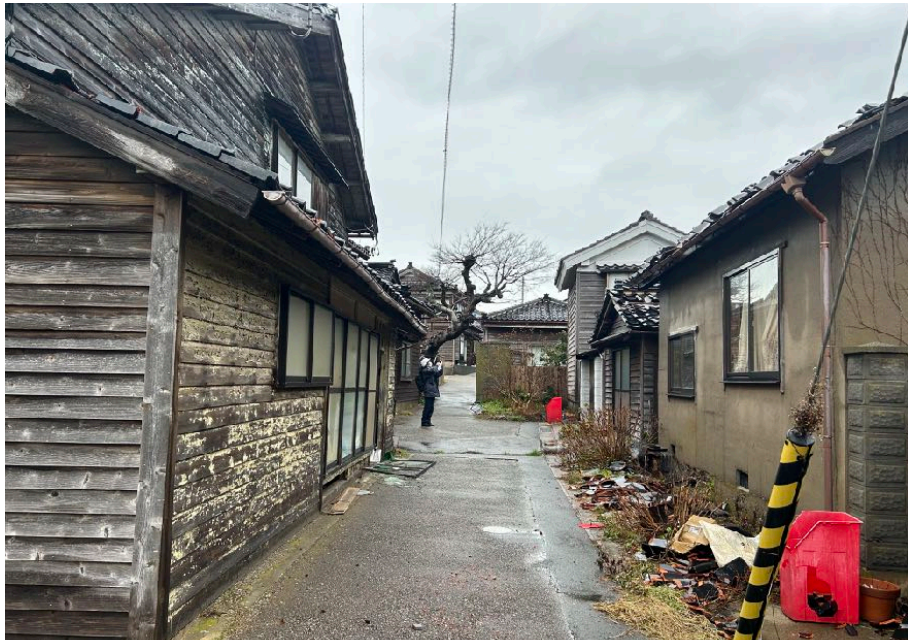
< ㉑ >