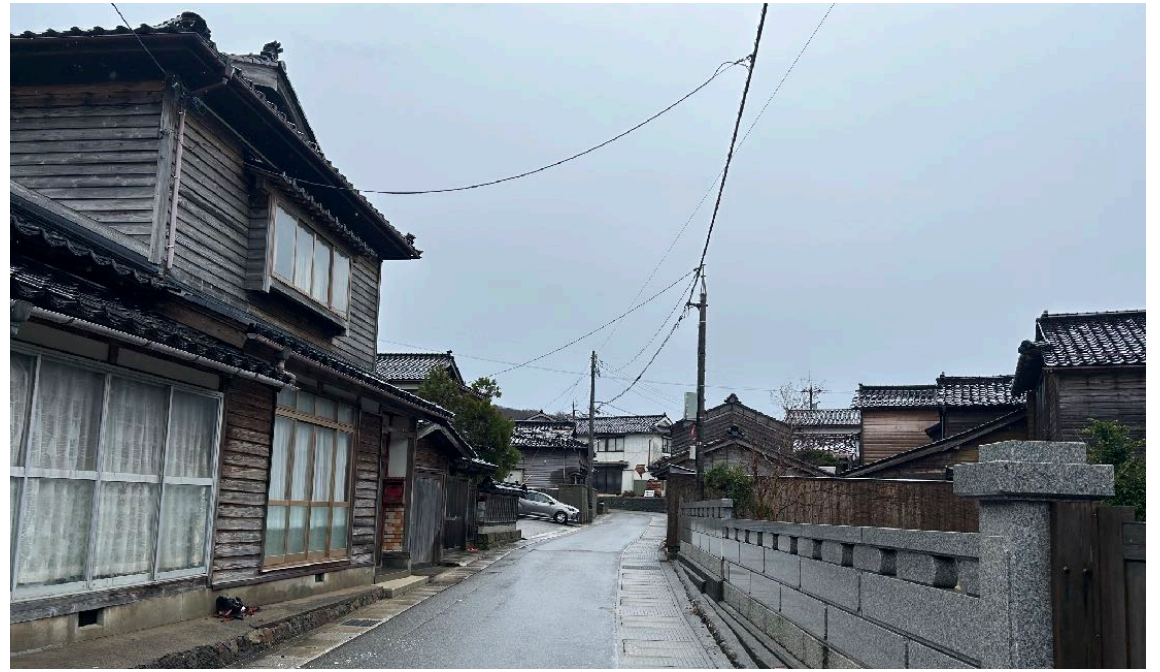
< ⑱ >