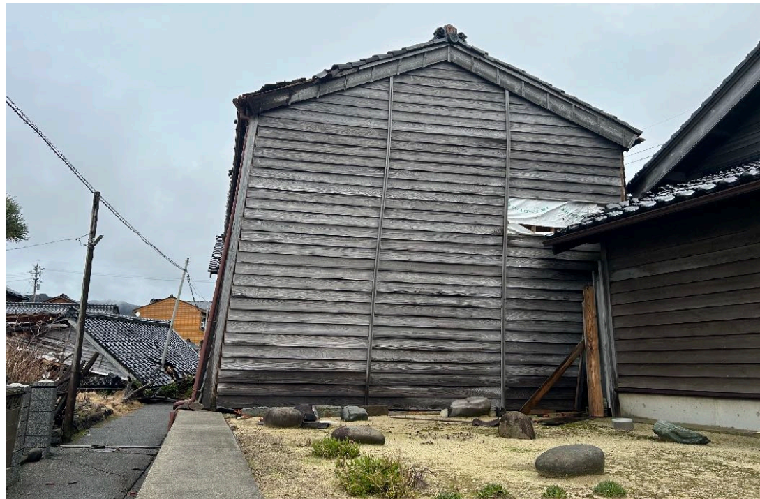
< 32 >