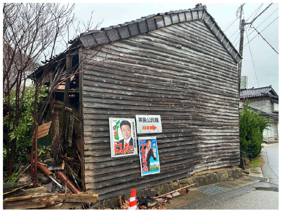
< ⑯ >