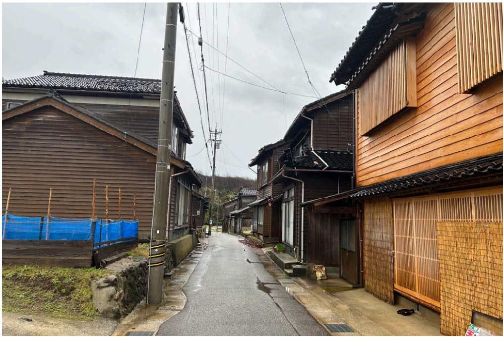
< ⑲ >