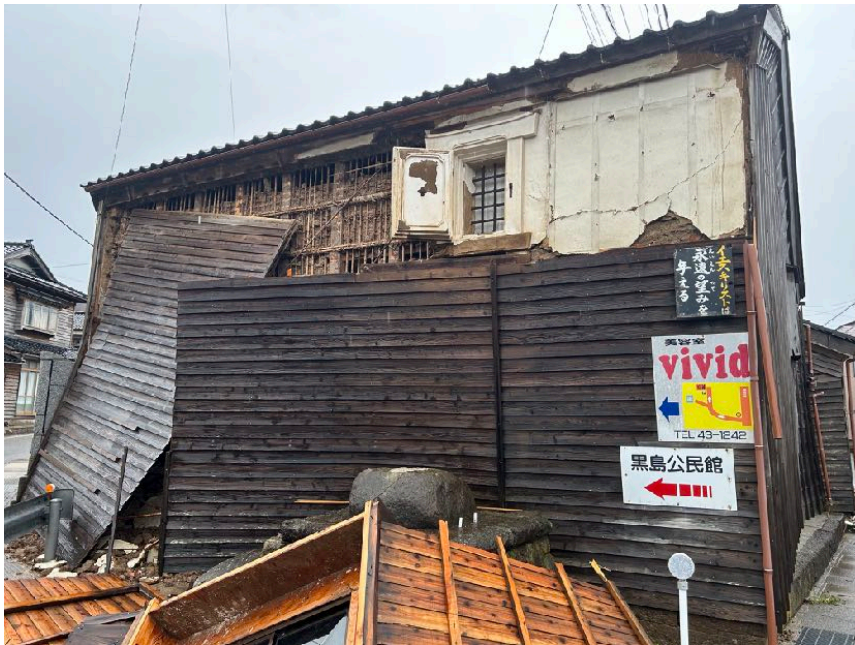
< ⑰ >