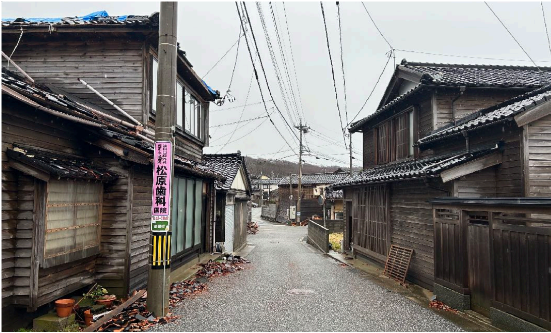
< ⑮ >