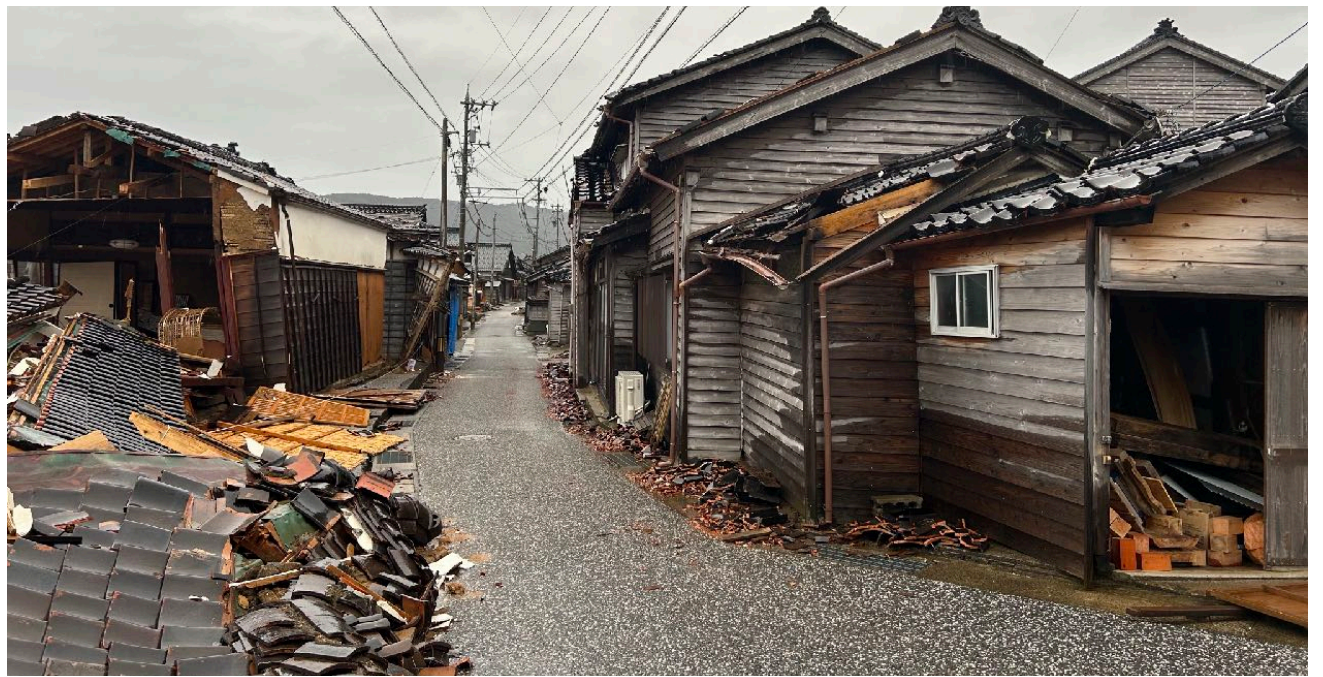
<③ (左が旧角海家住宅)>